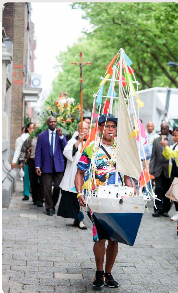
São João Rotterdam

In de Inventaris Immaterieel Erfgoed staan voorbeelden met een relatie hebben met religie en/of of gebedshuizen. Denk aan de uitvoering van de Matthäuspassion, Chanoeka, Allerzielen, orgelcultuur, beiaardcultuur, Gregoriaanse zang en begraven. Een ander, Zuid-Hollands voorbeeld in de inventaris van KIEN , is de Rotterdamse viering van São João Baptista . Deze hangt sterk samen met de maritieme connectie tussen Kaapverdië en Rotterdam, waar Kaapverdiaanse zeelieden zich vanaf de jaren '50/'60 vestigden. Zij ontmoetten elkaar op het Heemraadsplein – ook wel Pracinha d'Quebrôd genoemd – en begonnen daar vanaf eind jaren '70 met het vieren van São João, of 'San Jon'. Als start van het feest is er een viering in de HH. Laurentius & Elisabeth Kathedraal. Vervolgens is er onder begeleiding van de tambor (trommel), de Kola San Jon (dans) en het bootje een processie naar het Pracinha d'Quebrôd, waar het feest losbarst met Kaapverdiaans eten, muziek en ontmoetingen.