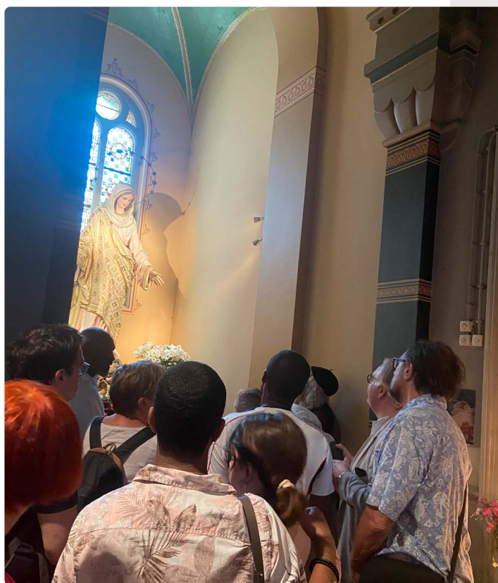
Maria-pelgrimage door Rotterdam tijdens Heilige Huisjes Rotterdam 2023

Het is altijd verstandig om aansluiting te zoeken bij ander gemeentelijk beleid. Zoals cultuurbeleid, aangezien lokale culturele instellingen ook aandacht kunnen besteden aan immaterieel religieus erfgoed. Denk ook aan vormen van cultuurparticipatie die een link hebben met immaterieel religieus erfgoed; zoals zingen in een koor, het bespelen van een orgel of carillon en andere cultuurvormen die je in een gebedshuis kunt beleven of uitoefenen. Lokale gemeenschappen houden het religieus erfgoed levend. Religieus erfgoed verbindt generaties en speelt in die zin een belangrijke rol binnen het sociale domein. Denk hierbij ook aan het maatschappelijk werk dat van oudsher vanuit religieuze organisaties wordt verricht.