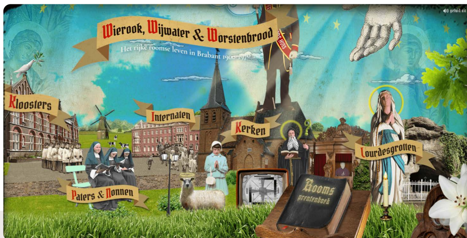
Website 'Wierook, Wijwater en Worstenbrood'

Het plaatsen van monumenten op een digitale kaart is gebruikelijk. Maar hoe doe je dit met verhalen en herinneringen, die persoonlijk en veranderlijk zijn? Met de site Wierook, Wijwater en Worstenbrood wil het Brabants Historisch Informatie Centrum (BHIC) de herinneringen aan het 'Rijke Roomse Leven' in Brabant levend houden. Op een online kaart zijn bestaande en verdwenen kerkgebouwen te zien. Aan de locaties zijn, vooral persoonlijke verhalen ver-