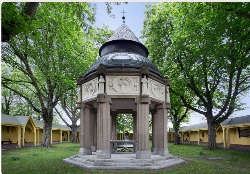
Heilige Martelaren van Gorinchem in Brielle