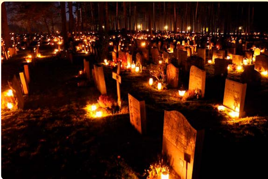
De viering van Allerzielen op een begraafplaats.

Meer lezen over de complexiteit van het begrip 'religieus erfgoed'? Zie de bijdrage van Birgit Meyer, ' What is religious – about - heritage? ' in het in 2023 verschenen Bloomsbury Handbook of Religion and Heritage in Contemporary Europe .