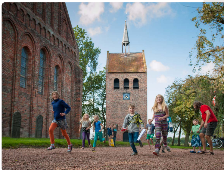
Kinderen bij de oude kerk van Garmerwolde

Een ander mooi educatief voorbeeld is de Schoolkerk in Garmerwolde in Groningen. Groninger Kerken gaf een architect en twee designers de opdracht tot de verbouwing van een klokkentoren bij een middeleeuwse kerk. De toren is omgebouwd tot tentoonstellingsruimte, waarin jongeren kennismaken met verschillende religieuze feesten en tradities: Feest! In Oost en West (onderdeel van 'Weet wat je viert' van Museum Catharijneconvent). Op de website van de Schoolkerk is meer te lezen over de lesprogramma's en -methode.